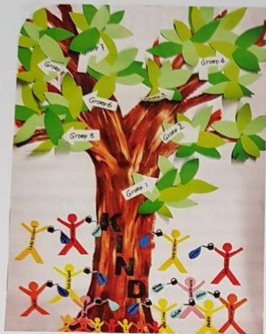
Visualisatie van de wijze waarop team en ouders van de Phoenix beschikbaar willen zijn voor de kinderen.

geef je afstandsonderwijs mét ouders vorm? Vanuit de daltonkernwaarden samenwerking, zelfstandigheid en verantwoordelijkheid hebben we vertrouwen en verbinding tot belangrijke uitgangspunten gemaakt. Het contact en de samenwerking met ouders bleek meer dan anders van belang. We wilden ouders niet als tweederangs leerkrachten inzetten, maar samen met hen het eigenaarschap van kinderen vergroten. Want er werd binnen het onderwijs op afstand veel van de zelfstandigheid en eigen verantwoordelijkheid van de kinderen gevraagd. Wij hadden er vertrouwen in dat onze kinderen, als 'fearless human beings', dit aankunnen. We gaven onszelf de opdracht dat we elke week contact met ouders zouden hebben. In veel groepen is dit goed gelukt. Juist omdat de leerkrachten ervaren dat het contact met de ouders zoveel meerwaarde had in deze periode: samen optrekken en afstemmen. Dit is één van de dingen die het team graag wil behouden voor de toekomst. Ook met de ouders en de kinderen willen wij nog verder 'goud-zoeken': wat nemen we mee, willen wij behouden, van deze periode van onderwijs op afstand?